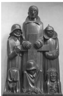
Magdeburger Ehrenmal, do expressionista alemão Paul Gauguin, 1929