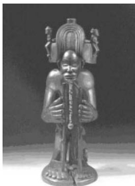
Estátua Real Chibinda Ilunga/ Angola, séc XIX